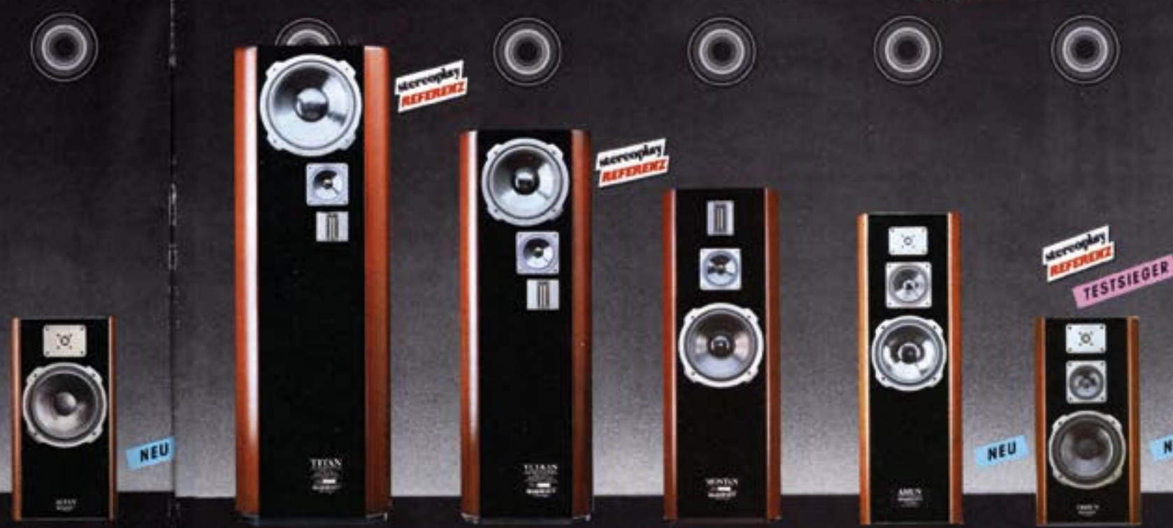
ALTAN TITAN VULKAN MONTAN AMUN TRIBUN geschlossen 60/100 Watt Stückpreis: DM 448,-* Real-Transmission-Line 250/500 Watt Stückpreis: DM 6.000,-* Real-Transmission-Line 150/250 Watt Stückpreis: DM 3.250,-* O. L. C. D.-Prinzip 150/200 Watt Stückpreis: DM 1.998,-* Bassreflex 100/150 Watt Stückpreis: DM 998,-* Bassreflex 80/120 Watt Stückpreis: DM 648,-*